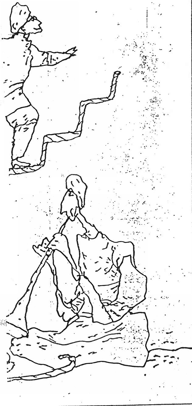
Tegning: Per Marquard Otzen

retagender. Desuden er folk med mellemindkomster - heriblandt indere i udlandet - begyndt at købe aktier i stort omfang.