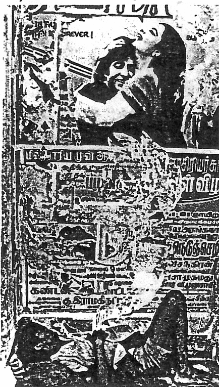
Misär och medelklassens drömmar stada vid sida.

Ris och vete utgör 95 procent av Indiens rislager. Bara omkring 20 procent av jordbrukarna som äger omkring 25